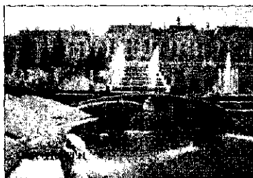
Петергоф. Большой каскад

Джессика хорошо знает Петербург. Она часто бывает в театрах и музеях. Недавно она была в театре на балете «Спящая красавица». А вчера Джессика и её русская подруга Нина были на экскурсии в Петергофе. Они гуляли в парках и садах, были в Большом дворце.