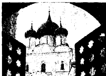
Старинная архитектура российских городов. Церкви Ярославля и Суздаля