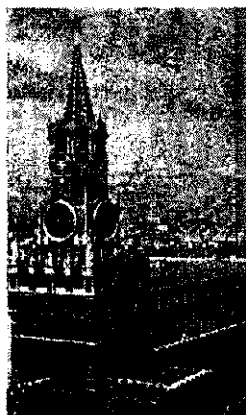
Москва. Спасская башня Кремля