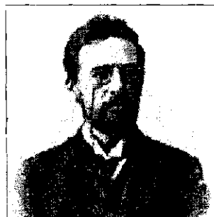
А. П. Чехов

«Антон Павлович Чехов (1860—1904) — замечательный русский писатель, драматург, врач. Сам Чехов более всего ценил себя как автора коротких рассказов. «Умею коротко говорить о длинных предметах», — писал он о себе. На двух-трёх страницах Чехов мог отразить мир во всём его многообразии, создать полную картину человеческой жизни».