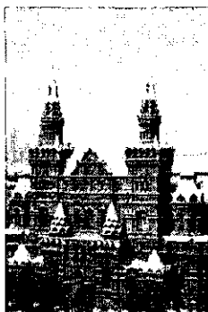
Москва. Здание Исторического музея