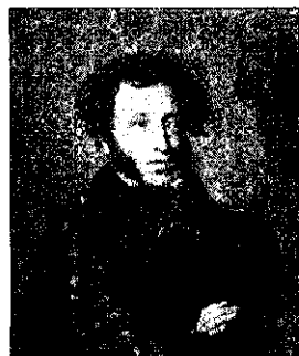
А. С. Пушкин

До 12 лет Пушкин учился дома. Он занимался с гувернёрами и выучил французский, немецкий и английский языки.