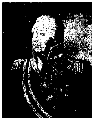
М. И. Кутузов

мое страшное из моих сражений — это то, которое я дал под Москвой».