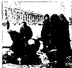
Жители блокадного города