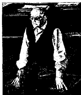
Д. Д. Шостакович

Центром событий этого дня была Ленинградская филармония, где впервые должна была исполняться Седьмая симфония Дмитрия Шостаковича.