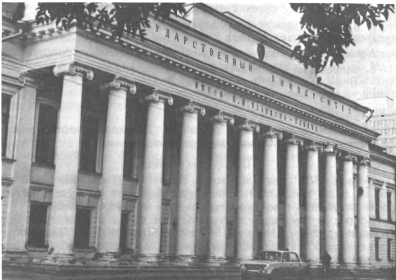
Казанский государственный университет имени В. И. Ульянова-Ленина

прекрасно писал сочинения, с большим интересом занимался литературой и историей. Он думал: «Какой факультет выбрать? Историко-филологический или юридический?» В то время в программе историко-филологического факультета произошли реакционные изменения. В новой программе факультета главное место занимали древние языки. Для студентов этого факультета читали 18 лекций в неделю, из них 14 лекций было по древним языкам и древней литературе. Даже если студент хотел изучать русскую историю, т. е. историю своей страны, или русскую литературу, он должен был много времени заниматься латинским и греческим языками, читать книги на этих языках. Царское правительство считало, что чем больше студенты будут заниматься древней историей, тем меньше они будут изучать жизнь народа своей страны, тем меньше будут заниматься революционной работой. Все это не нравилось Владимиру Ульянову.